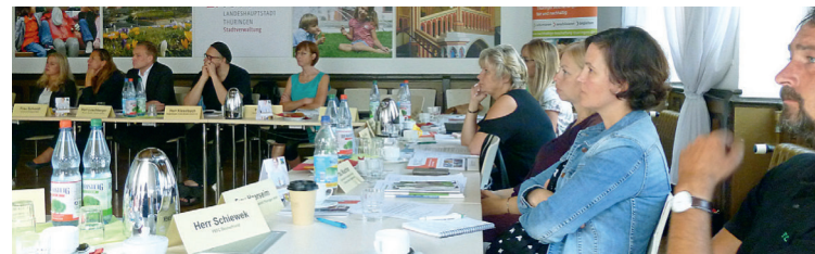
Marktdialog zum Thema „Bürobedarf nachhaltig einkaufen“ in Erfurt

Bei den Marktdialogen , einer Veranstaltungsreihe des Projektes, bringen wir Unternehmen und öffentliche Beschaffungsstellen vor Ausschreibungen in einen offenen Dialog, bei dem die Einhaltung von sozialen und ökologischen Kriterien thematisiert wird.